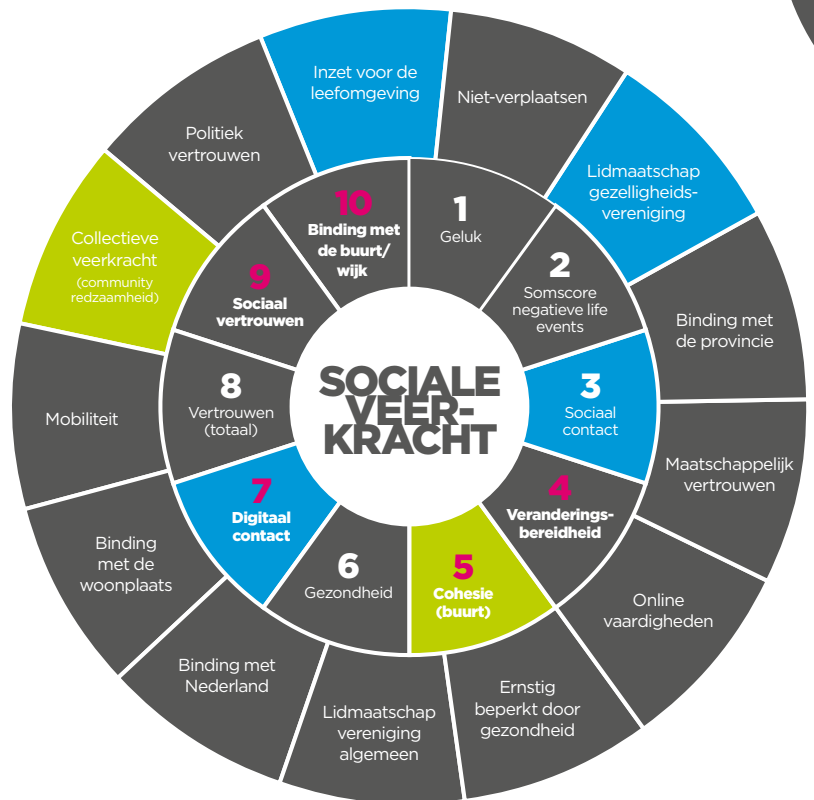
(Monitor Sociale Veerkracht 2018)

de mate waarin (men verwacht dat) de directe omgeving een maatschappelijke opgave kan aanpakken.